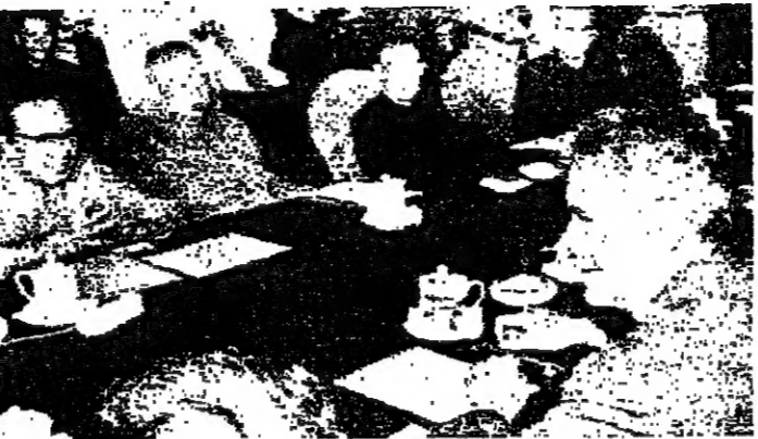
فلس أثناء محادثته في بكين مع هوانغ هوا وزير الخارجية الصيني

بعث الرئيس حافظ الانيد برقية تهنئة الى الرئيس الروماني شوشيسكو بمناسبة العيد الوطني لرومانيا ، ونش فيها للرئيس الروماني طبيب الاتي ، ولشعبه العظيم حوام التقدم والازدهار .